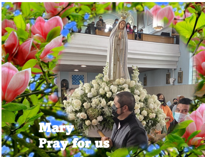
Mary Pray for us

Come, O Divine Spirit, fill my heart with Thy heavenly fruits, Thy charity, joy, peace, patience, benignity, goodness, faith, mildness, and temperance, that I may never weary in the service of God, but by continued faithful submission to Thy inspiration may merit to be united eternally with Thee in the love of the Father and the Son. Amen.