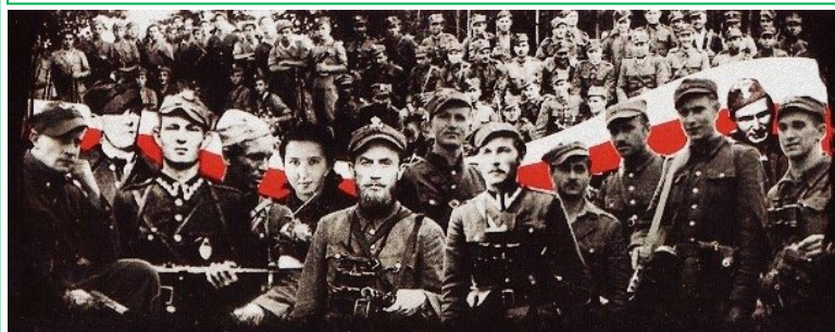
1 marca - Narodowy Dzień Pamięci Żołnierzy Wykłętych

Powinniśmy unikać osądzania innych: △ Nikt poza Bogiem nie jest wystarczająco dobry, aby osądzać innych, ponieważ tylko Bóg widzi całą prawdę i tylko On potrafi czytać w ludzkim sercu. Dlatego tylko On ma zdolność, prawo i autorytet, by nas osądzać. △ Nie widzimy wszystkich faktów i okoliczności ani mocy pokusy, która skłoniła człowieka do zrobienia zła. △ Często jesteśmy uprzedzeni w ocenie innych i nie można od nas oczekiwać całkowitej uczciwości, zwłaszcza gdy osądzamy tych, którzy są nam bliscy lub bliscy.